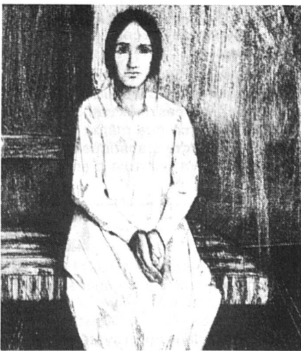
Gravure de Pierre Lafillé.

« Les femmes, note Elisabeth Biaudet, la femme médecin à qui l'on doit d'avoir attiré l'attention des experts du programme du FNRS sur le problème de la consommation médicale féminine (cf. FS