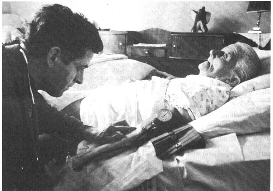
La consommation médicale augmente avec l'âge...