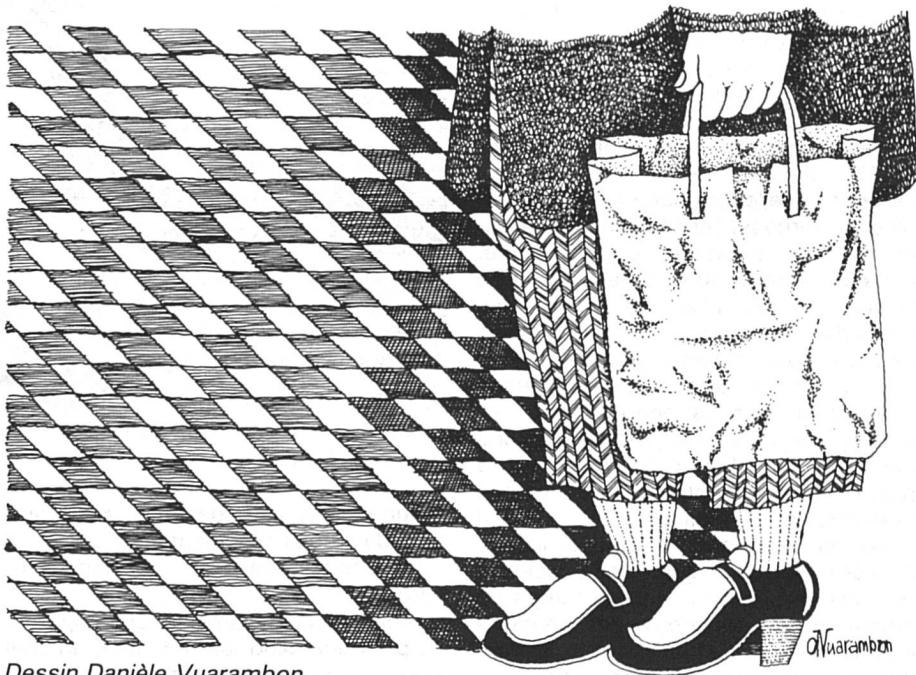
Dessin Danièle Vuarambon

A : J'ai été satisfaite, mais cela n'avait pas tellement d'importance.