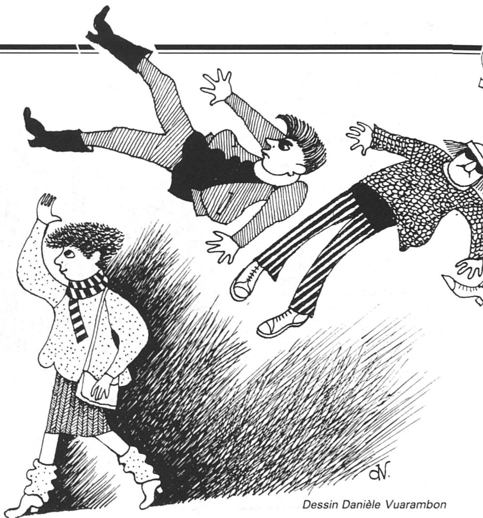
Dessin Danièle Vuarambon

« Quand on avance en âge, plaide la présidente de l'AUF, il devient pénible de passer toute la journée loin de chez soi. » Elle indique d'un geste les villas familiales qui entourent sa propre maison, dans un quartier résidentiel de Zofingue. « Là autour, il n'y a que des familles avec enfants, et des mères qui restent à la maison. L'été, je les vois manger au jardin à midi, puis l'homme et les enfants repartent ; la femme range bien tranquillement sa cuisine, et quand elle a fini elle