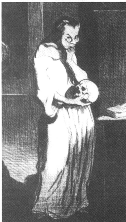
Femme de lettre humanitaire se livrant sur l'homme à des réflexions crânement philosophiques ! selon H. Daumier.