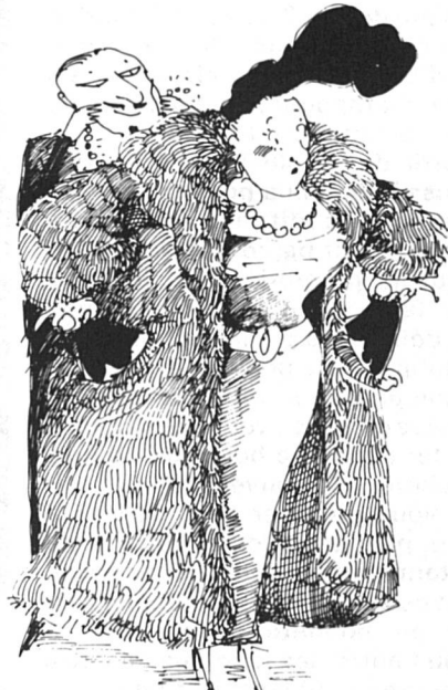
La femme mariée Pauvreté invisible