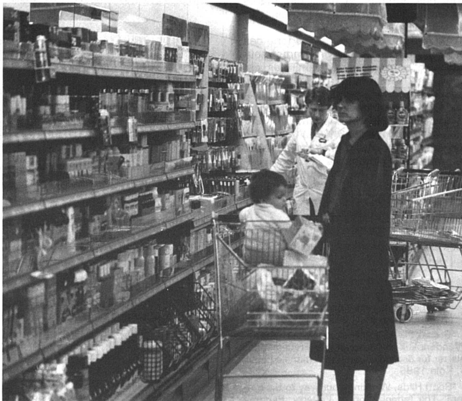
Pour les mères seules, un budget souvent serré.