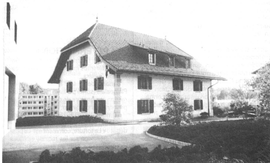
A Grangeneuve, le bâtiment des Mésanges qui abrite le Centre de formation féminine pour l'agriculture, sa direction et son service de vulgarisation ménagère agricole.

En 1959, le but est atteint sur le plan communal et cantonal : les femmes neuchâteloises recevront enfin leur carte d'électrice. Mme Pingeon met alors sur pied des cours d'instruction civique qui inciteront les femmes à user de leur nouveau droit, à prendre conscience de la