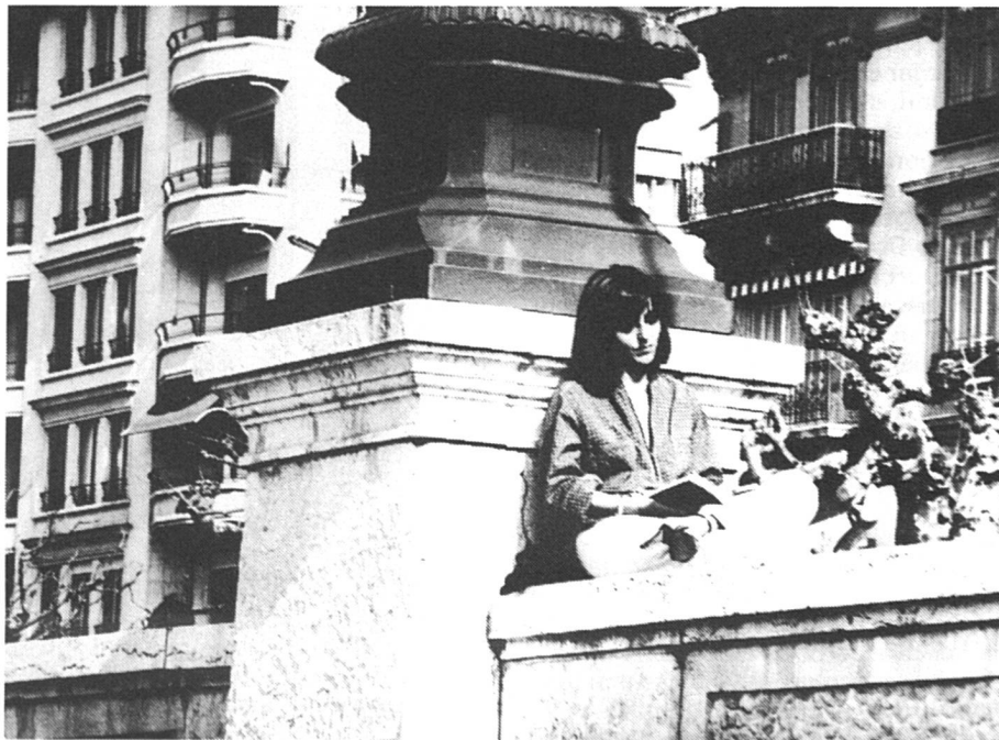
Davantage de vacances ?

Dans ce premier train de mesures, qui sera d'ailleurs suivi d'un second, actuellement au stade de la consultation des cantons, partis politiques et organisations intéressées, huit mesures, déjà approuvées par les Chambres fédérales, font l'objet d'une révision législative et n'ont, par conséquent, pas besoin d'une sanction populaire, du fait qu'elles n'ont pas été attaquées par un référendum. Pour l'essentiel, ces mesures se tradui-