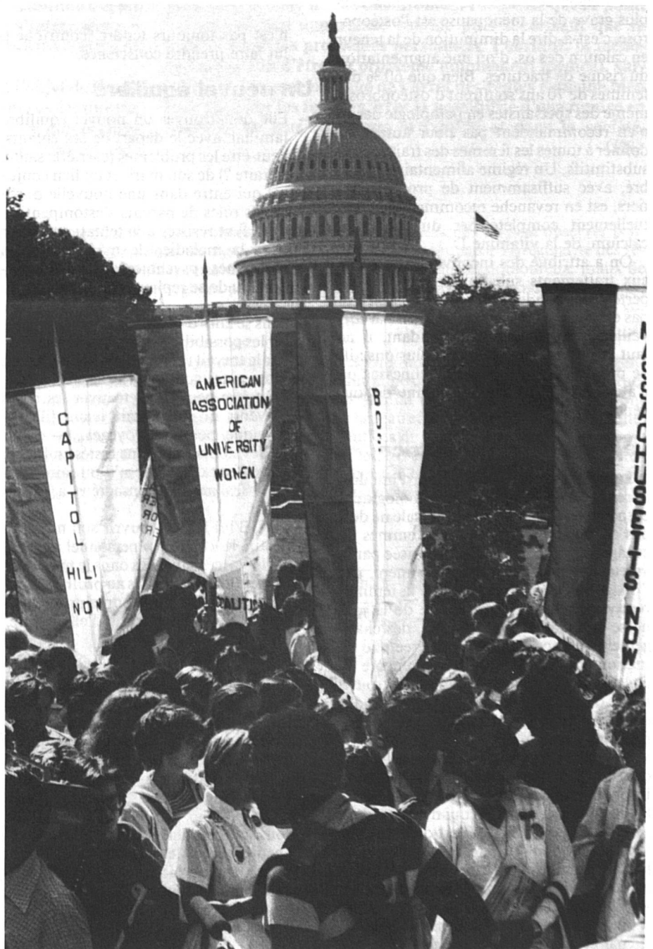
Manifestation pro-ERA à Washington