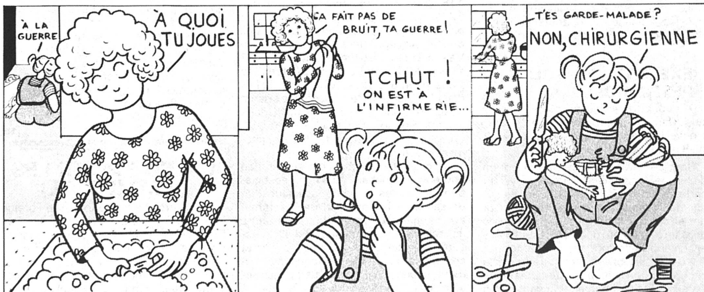
La Gazette des Femmes, octobre 1980.

Ainsi l'application de l'égalité au niveau du quotidien et des lois se met en route. Souhaitons à cette première commission un bon démarrage. — (jbw)