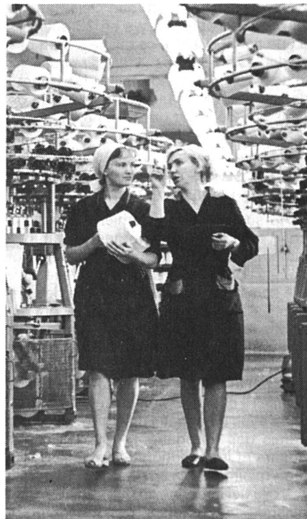
En URSS, 93 % des femmes travaillent ou étudient.

FS : Toutes ces mesures, si elles aident les femmes, n'incitent guère