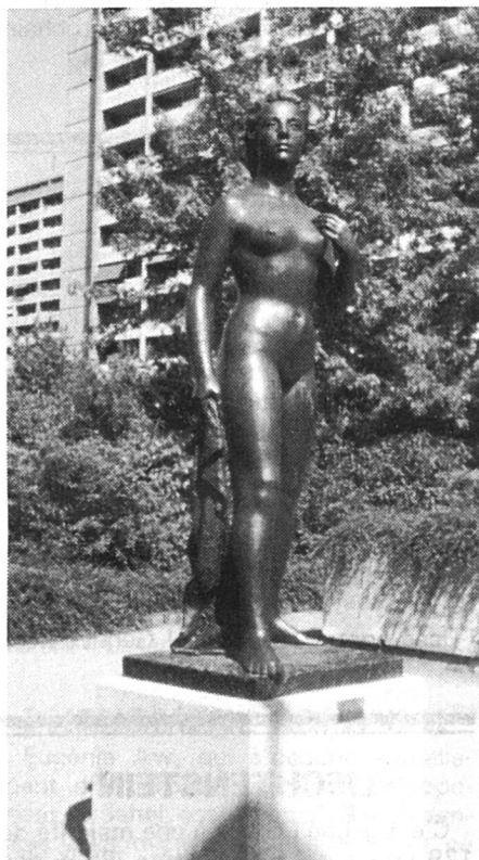
Henri König, « Jeunesse », 1974.

— Ne me dis pas que tu es toujours troublée par tes rondeurs mal placées ? Franchement, je te croyais plus libérée !