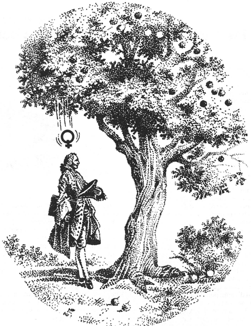
Illustration « Femmes d'Europe »