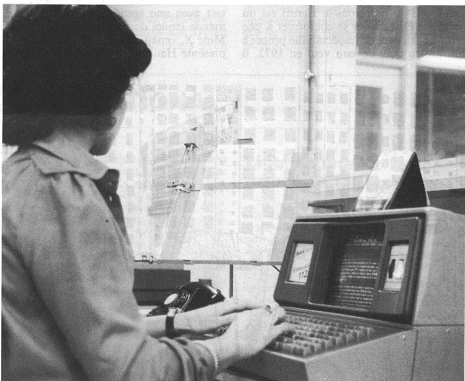
Une photocomposeuse au travail

L'ordinateur sert aussi bien à enregistrer des données et à les restituer instantanément sur demande, qu'à faire, à la seconde, des calculs qui auraient pris des heures ou des jours, ou qu'à commander des machines-outils, jusqu'aux robots y compris. Il est à la mémoire et au cerveau ce que l'outil