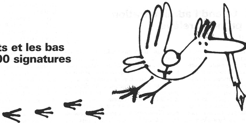
Dessin Agenda de la Femme 1981