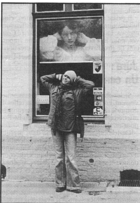
Photographe, Mireille Maye

Exposition de photos « Regard au féminin », de Mireille Maye, à la Librairie et galerie des femmes « La Mauvaise Graine », 4 rue du Tunnel, 1005 Lausanne, jusqu'au 12 avril. Voir horaires ci-dessus.