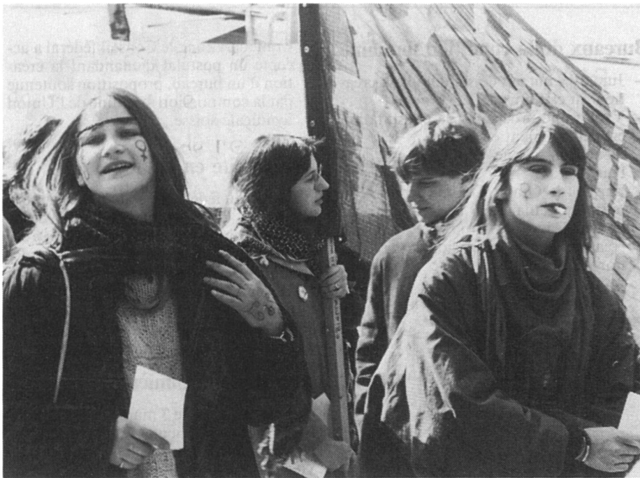
A Lausanne le 6 mars