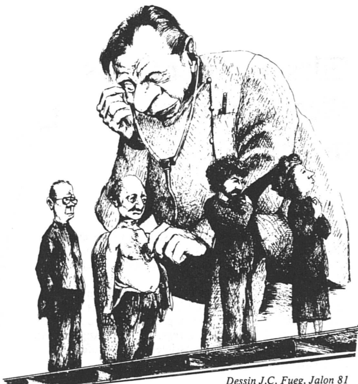
Dessin J.C. Fuego, Jalon 81

L'étude a mesuré bien d'autres variables, notamment l'incidence des milieux sociaux sur la consommation médicale, le do-