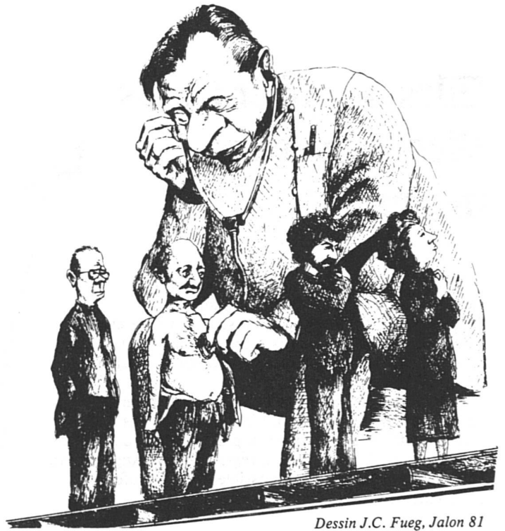
Dessin J.C. Fuego, Jalon 81

L'étude a mesuré bien d'autres variables, notamment l'incidence des milieux sociaux sur la consommation médicale, le do-