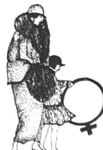
L'enfant au cerceau (42 x 61)