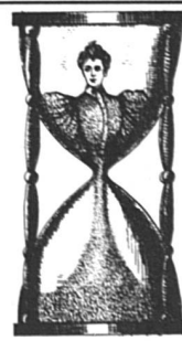
La femme au sablier (39 x 59)