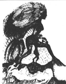
La femme au feuillage (42 x 61)