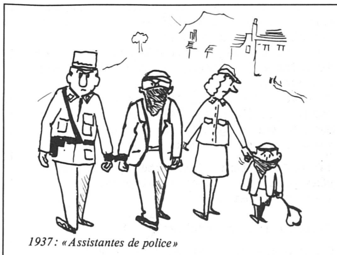
1937: « Assistentes de police »

Plantons, rondes, patrouilles, accidents, écoles, voilà, en résumé, la vie des femmes de la Brigade des agentes de la circulation (BAC). A Genève, elles sont 44, c'est-à-dire 7 % d'un corps de 608 hommes. A elles seules, elles monopolisent tous les piédestals de la ville d'où elles règlent la circulation, activité maintenant exclusivement féminine. Certes, elles encadrent les jeunes gendarmes qui sont en école de formation, mais c'est uniquement « pour le cas où ils devraient régler la circulation », ce qui