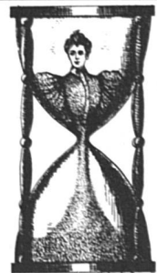
La femme au sablier (39 x 59)