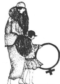
L'enfant au cerceau (42 x 61)