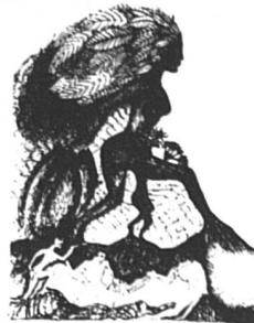
La femme au feuillage (42 x 61)