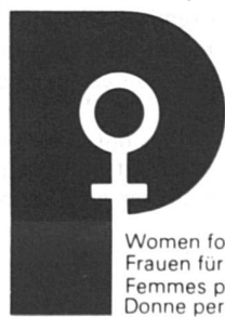
Women for Peace Frauen für den Frieden Femmes pour la Paix Donne per la Pace

FS en a déjà parlé à propos de la manifestation, accompagnée d'un jeûne, que ces groupes ont organisée à Genève. Depuis que le mouvement a été lancé en 1976 par Aline Boccardo, ils ont mis sur pied des expositions à Zurich, Menzingen et Frauenfeld; envoyé une pétition avec 18 000 signatures à la session extraordinaire des Nations Unies sur le désarmement; manifesté lors d'une journée portes ouvertes de l'armée à Zurich; adressé une requête aux Chambres contre la motion Friedrich qui voulait obtenir un assouplissement de la loi sur les exportations d'armes; milité en faveur de la création d'un institut suisse de la paix; pris contact avec les organisations féminines, etc.