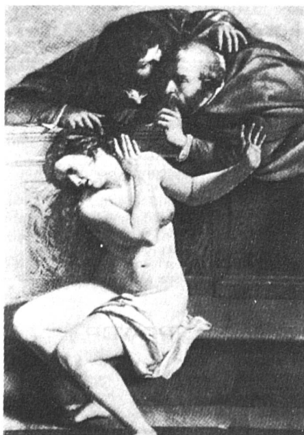
Des noms oubliés... Artemisia Gentileschi (1593-1652)

(Dictionnaire de l'art contemporain, Larousse)