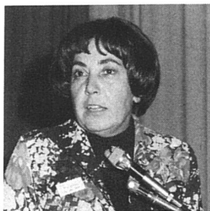
J. Berenstein-Wavre