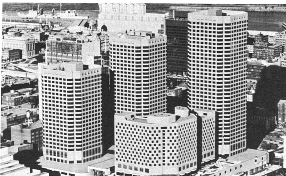
Montréal - Méridien

Le huitième congrès biennal de l'Association internationale des journalistes de la presse féminine et familiale a réuni à Montréal (Canada) entre le 18 et le 24 octobre dernier quelque 120 participants venus de 17 pays.