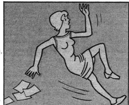
Les illustrations sont extraites de «Vivre en Sécurité, voir le Danger», de Harold Potter, édité par la Caisse nationale suisse l'assurances et Winterthur-Assurances.

Rien de tel n'existe pour l'heure en Suisse romande. Et c'est pourquoi l'Alliance de sociétés féminines suisses désire savoir si l'intérêt des ménagères romandes dans ce domaine peut justifier l'organisation d'un cours. L'ASF vous serait reconnaissante de bien vouloir retourner le questionnaire ci-dessous à l'administration de «Femmes suisses», 9, rue du Velodrome, 1205 Genève.