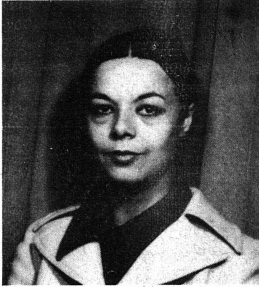
Une nouvelle rédactrice que nous sommes heureuses de présenter: