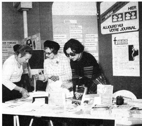
Un bon souvenir : Le panneau « Femmes Suisses » au Salon des Arts Ménagers, à Genève, en octobre dernier.