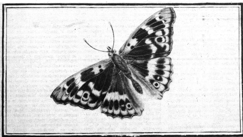
Oeuvre de Maria Sibylla Merian