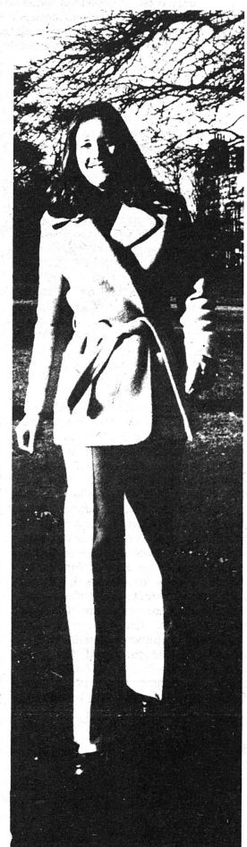
Des horizons plus vastes.