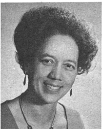
Tilo FREY radicale

Professeuse à l'Ecole de commerce de Neuchâtel, dès 1964 conseillère générale (présidente en 1970-71), dès 1969 députée au Grand Conseil. Présidente du groupe féminin du parti radical dont elle est membre du comité directeur.