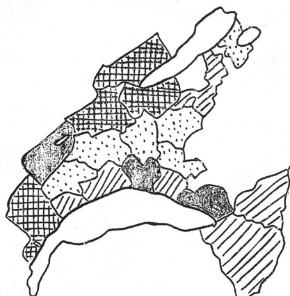
Proportion des femmes exerçant une profession

Il existe une relation certaine entre l'importance de la population féminine professionnelle active et la façon dont la femme est acceptée dans la vie politique