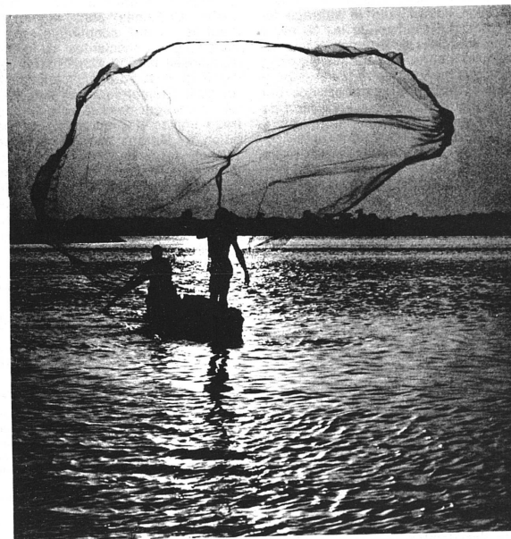
qui centre actuellement son action sur l'Inde et le Tchad. C.C.P. Lausanne 10 - 1533.

Etre toujours prêt à jouir de la beauté du monde et des choses