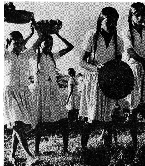
Ces jeunes Indiennes du Mahdi prêtent la main à la construction d'une école secondaire d'agriculture, travail financé en partie par l'Aide suisse à l'étranger. Elles recevront là une formation qui les inspirera dans l'organisation de leur existence familiale, et aussi dans l'amélioration de la vie au village.