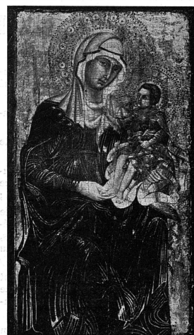
Barnaba da Modena: « La Vierge et l'Enfant »