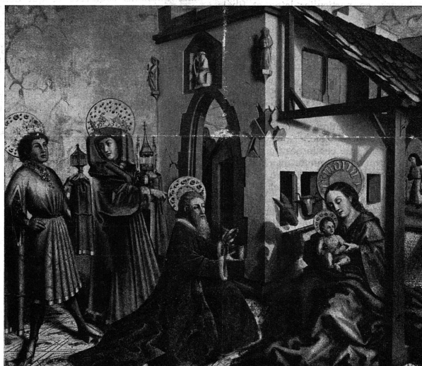
Conrad Witz: « L'Adoration des Mages »

suicide? Et les femmes ne devraient-elles pas avoir compris aussi que cette société qui les fonde dans le même moule, qui les déshabille, les expose, ne les courtise qu'en apparence pour mieux les mépriser, les traiter plus en esclaves qu'en êtres humains?