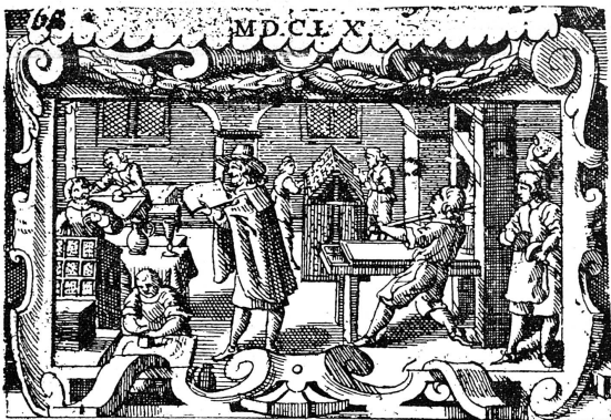
Intérieur d'imprimerie pris dans un livre du XVII e siècle. On voit représenté tout le personnel nécessaire; les deux compositeurs n'ont pas de copie sous les yeux, mais composent sous la dictée d'un lecteur, ou anagiste, installé au fond à droite, qui déchiffre le manuscrit. (D'après l'interprétation du bibliographe Madden).

rent et protestèrent. L'Union des femmes de Genève organisa une exposition de curiosités typographiques et une conférence sur ce sujet « La femme et la typographie ». C'est de cette conférence que nous extrayons la matière de cet article.