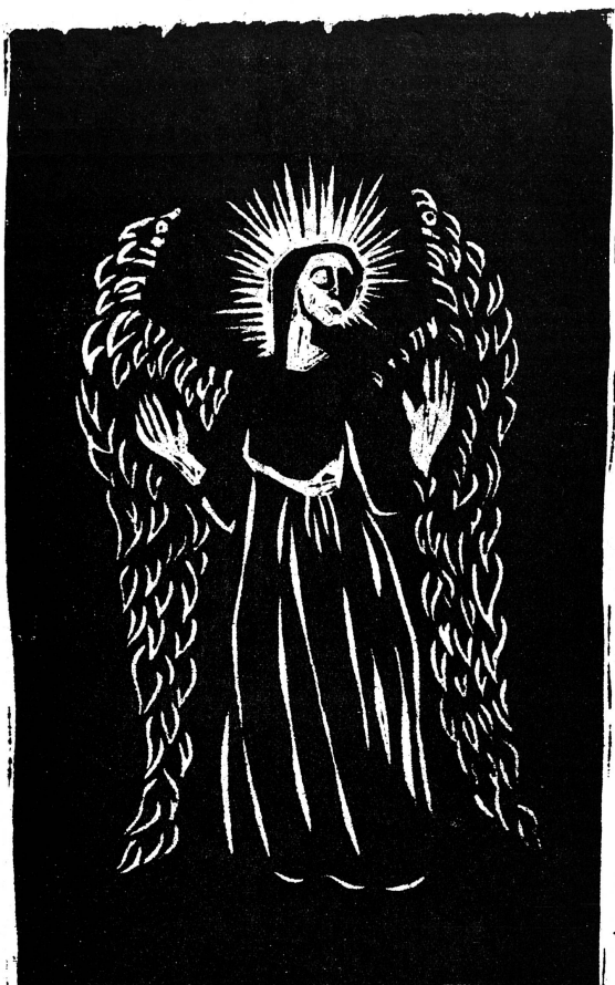
Bois gravé de Ruth Steinegger

Je vous annonce une bonne nouvelle qui sera pour tout le peuple le sujet d'une grande joie. »