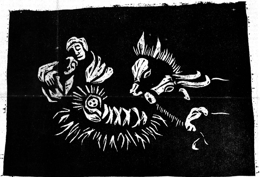
Bois gravé de Ruth Steinegger