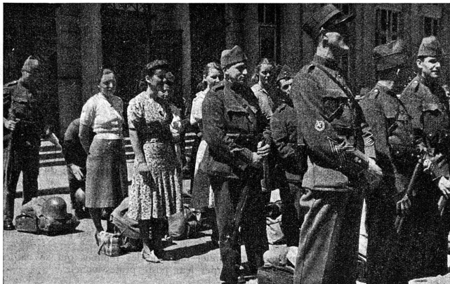
Equipe de cuisinières licenciée en même temps que la troupe en 1940. C'est un document rare : ces SCF n'ont pas encore d'uniforme

Le Conseil fédéral a reconnu la nécessité de la participation des femmes à notre défense nationale, et se fondant sur les expériences faites pendant le service actif de 1939-1945, il a fixé l'organisation de la plus jeune formation de notre armée par l'ordonnance du 12 novembre 1948.