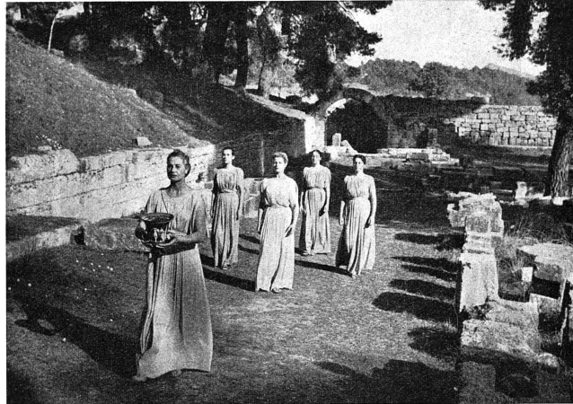
L'Hestias, suivie de la première prêtresse et des autres prêtresses, sort de la crypte du stade d'Olympie en portant le feu sacré. Elle se dirige vers le temple d'Ira (Cérémonie de la flamme olympique)

Au Congrès médical des sports, en Finlande, 1952, Ingman a communiqué les résultats d'une étude similaire, menée sur un groupe de 107 championnes, comprenant 9 nageuses, 13 gymnastes, 28 joueuses de bas-