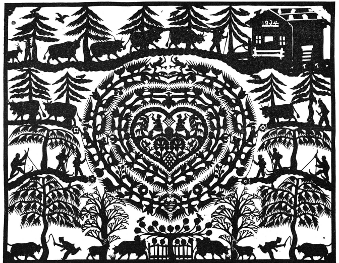
Cliché obligeamment prêté par la revue du club alpin suisse, « Les Alpes »