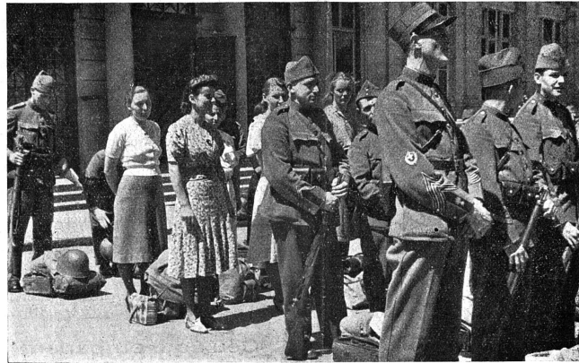
Services complémentaires féminins Des S. C. F. sont démobilisées en même temps que la troupe Ce cliché paru dans notre journal en juillet 1941 reprend de l'actualité.

Quant à l'accès aux hautes fonctions publiques, il importe de faire une distinction nette entre la notion d'éligibilité et celle de candidature. Si une loi sur l'égalité des droits civiques venait à passer, nous deviendrions