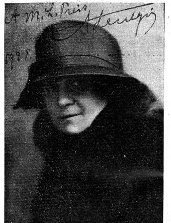
Ada Negri à l'époque de son séjour à Zurich pendant l'autre guerre.

proposait, mais à laquelle nous renoncâmes. Bien qu'entourée, fêtée, bien qu'aimant et admirant la Suisse, Ada souffrait de l'exil. Qu'aura été son retour au pays, qu'auront été en particulier ses dernières années? Nous l'ignorons, mais elle a certainement dû souffrir de se sentir oubliée, de connaître l'indifférence ou l'éloignement de la part des lecteurs, des critiques, des écrivains plus tard, elle qui avait été au pinacle. Mais elle eut néanmoins cette satisfaction, d'être la seule femme