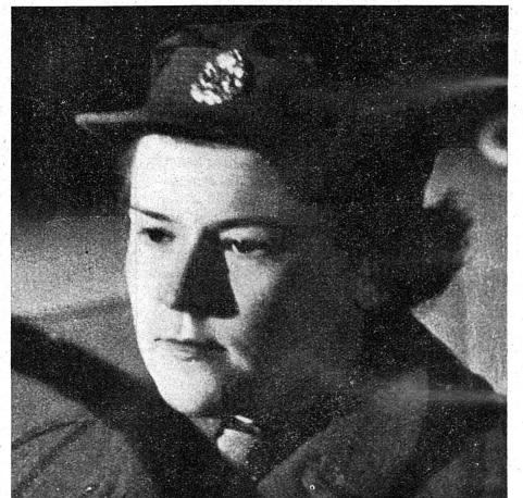
Une autre A. T. S. typiquement anglaise, héroïne du film: « Aux armes! Citoyennes! »