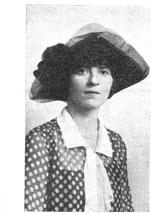
Miss Lucile ATCHERSON Vice-Consul des Etats-Unis à Berne, (1922) puis à Panama.