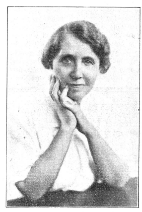
Miss Marg. HANNA Consul des Etats-Unis à Genève de 1936 à 1938.