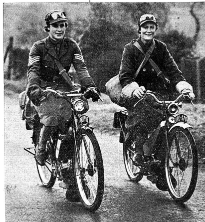
Deux motocyclistes du Service auxiliaire territorial féminin.

R.: Oui: deux vieillards et cinq enfants, dont