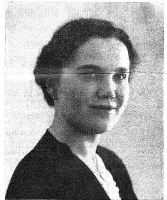
Châcité des Suffragist

Il n'a jamais été question d'obtenir le renvoi de