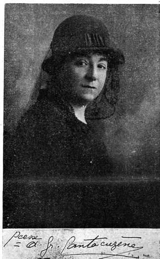
Cliché Mouvement Féministe La princesse Cantacuzène, à l'activité de laquelle est due pour une bonne part le succès des femmes roumaines.

Dans le monde en désarroi dans lequel nous vivons, il se produit parfois des événements à l'allure nettement paradoxale. Du nombre est celui dont la nouvelle vient de nous parvenir par un message de la princesse Cantacuzène: la reconnaissance du droit de vote aux femmes roumaines!