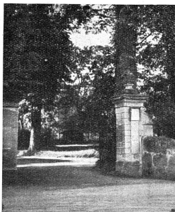
L'entrée de la Wegmühle, près de Berne.