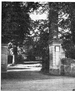
L'entrée de la Wegmühle, près de Berne.