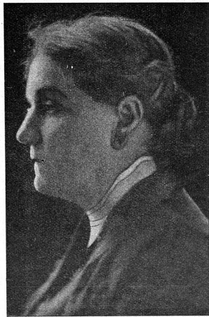
Cliché Mouvement Féministe Jane Addams

House, créé à Chicago en 1889, et où Jane Addams fixa sa demeure: Hull House, le premier settlement d'Amérique, le « settlement réconciliateur de mondes », sur l'exemple duquel il s'en éleva près de quatre cents aux Etats-Unis en l'espace de trente ans.