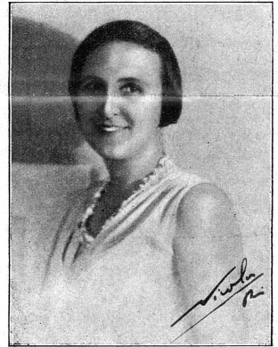
Cliché Mouvement Féministe